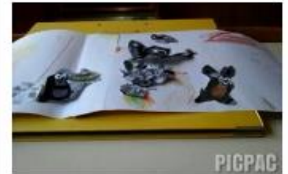
Kindergarten Stammbach Lucie Tarabová