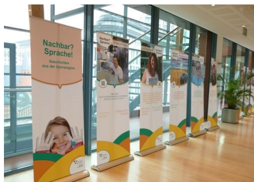
Sąsiad?Język! w Komisji Regionów, Bruksela