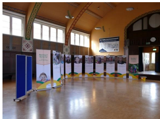
Sąsiad?Język! w auli Centrum Szkół Zawodowych im. Christopa Lüdersa, Görlitz