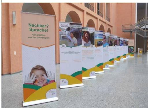
Sousedé?Jazyk! na Ministerstvu kultury Lichthof v Sasku, Drážďany