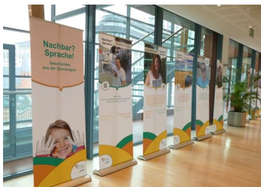
Sousedé?Jazyk! ve výboru regionu, Brusel